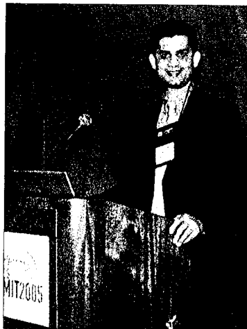
- Vor nye signalbehandlingsteknologi gør det praktisk og økonomisk muligt at øge hastigheden til 10 Gbit/s samtidig med, at eksisterende transmissionsudstyr kan bibeholdes, påpegede Abhijit Phanse

De to første IC-kredse fra Scintera er beregnet for enterprise og SAN (storage area network) netværk samt MAN (metro area network) netværk. De fiberoptiske multimode kabler i enterpri-